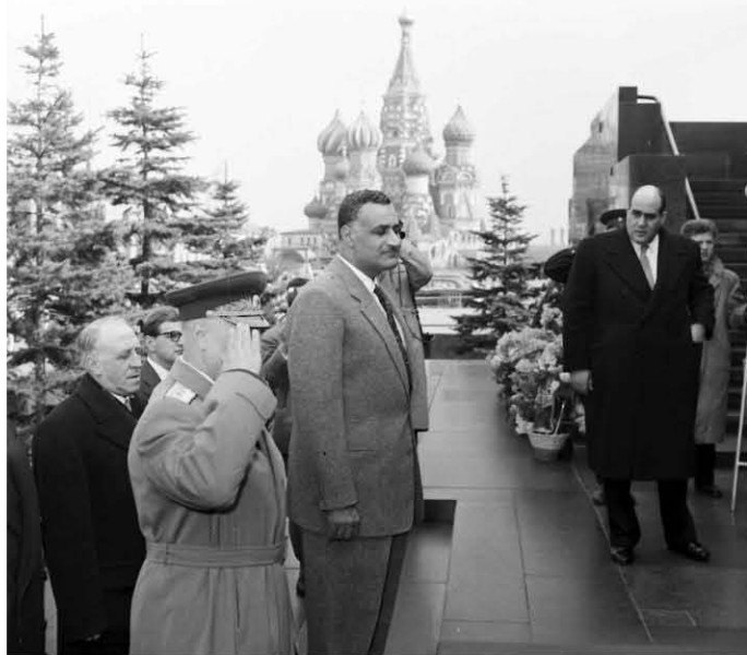
الرئيس جمال عبد الناصر يزور ضريح لينين أثناء زيارته للإتحاد السوفيتي يرافقه الرئيس الروسي فورشيوف